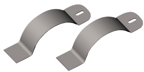
L99004 Kit voor gyproc